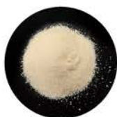
顆粒タイプ ヨーグルト風味