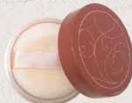
フェイスパウダー