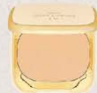
プレストパウダーUV