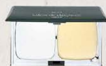
サロンドエレガンス ルーセントアップ