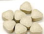
タブレットタイプ