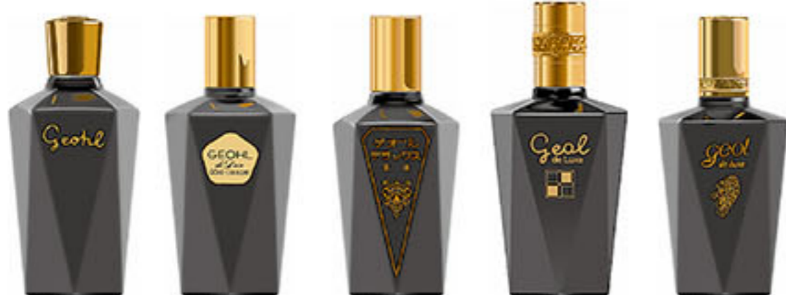
ゲオール 純金コロイド 1957~1970頃 ゲオール デラックス 1966~1972 ゲオール デラックス 1972~1974 ゲオール デラックス 1974~1980 ゲオール デラックス 1980~1987