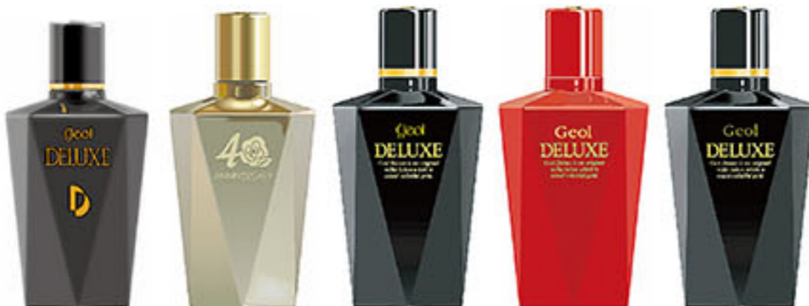
ゲオール デラックス 1987~1991 ゲオール化粧品 創業40周年 記念ボトル ゲオール デラックス 1991~2007 ゲオール化粧品 創業50周年 記念ボトル ゲオール デラックス 2007~現在