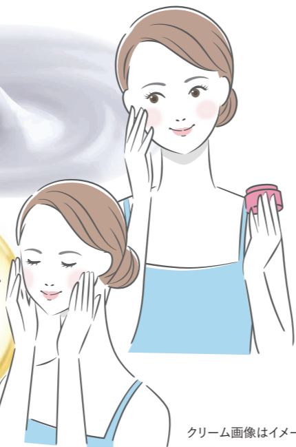
クリーム画像はイメージ